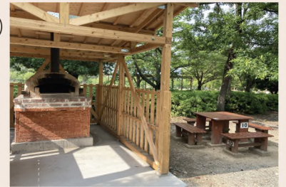
ピザ窯とテーブル