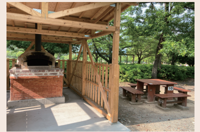
ピザ窯とテーブル